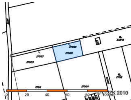
Zobrazení v grafickém prohlížeči

Parcelní číslo: 273/25 Výměra [m 2 ]: 418 Katastrální území: Medlešice 692573 Číslo LV: 324 Typ parcely: Parcela katastru nemovitostí Mapový list: DKM Určení výměry: Graficky nebo v digitalizované mapě Druh pozemku: orná půda